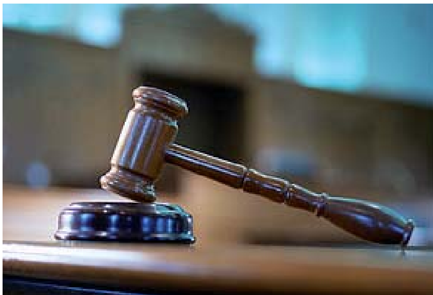
När domstolen avkunnat domen skickas den inom en vecka till Kriminalvårdens frivårds-kontor, om domen avser en person som inte är häktad eller i anstalt.

Om en person som dömts till fängelse inte redan är häktad eller placerad i anstalt för andra brott, är han eller hon på fri fot även efter att domstolen meddelat sin dom. Är man misstänkt för ett brott som kan ge fängelse i flera år och kan befaras förstöra bevis, försvåra utredningen eller fortsätta den brottsliga verksamheten, är man vanligtvis häktad.