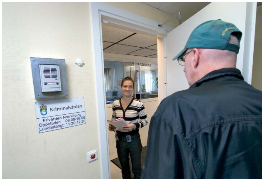
Frivård innebär kontroll och stöd. En klient anländer till frivårdskontoret.

F rivård är kriminalvård i frihet. Frivården övervakar