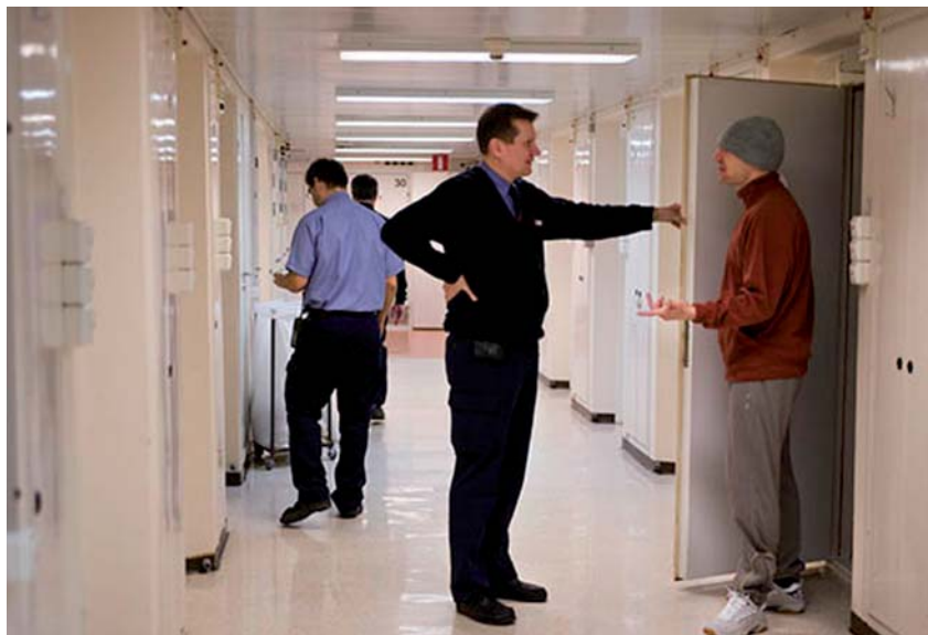
Det är sällan lugnt i en häkteskorridor. Bilden är från häktet i Norrköping.

I häkte sitter personer som misstänks för att ha begått brott och som häktats av domstol. I häktena kan också finnas gripna, anhållna, asylsökande som ska avvisas samt missbrukare eller psykiskt sjuka som tvångsomhändertagits och ska placeras på institution. Det görs en individuell plan för häktesvistelsen, och det påbörjas även en planering av verkställigheten av straffet i anstalt. Häktena ligger ofta i anslutning till ett polishus, ibland vid ett fängelse.